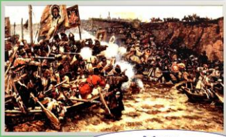
В. Суриков. Завоевание Сибири Ермаком.